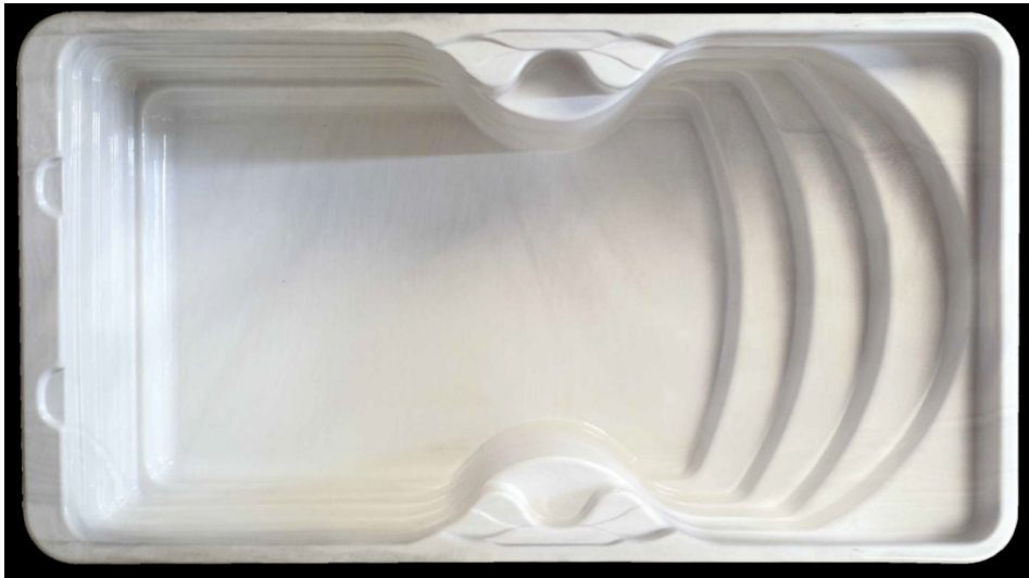
(afgebeeld in Sterling silver)